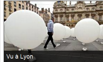
Vu à Lyon